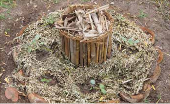
දින 15 පසු